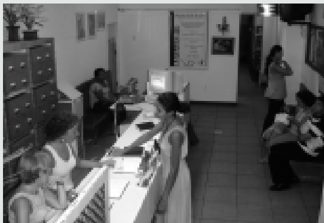
Atendentes do ambulatório receberam mais de 32 mil pessoas