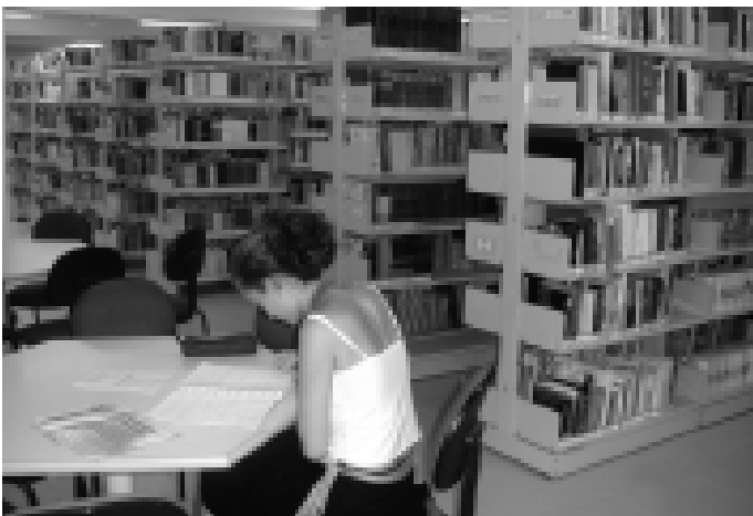
Biblioteca dispõe de mais de 51 mil livros e periódicos

A biblioteca está vendendo uma rifa de um MP3 player da marca Kely para arrecadar recursos para manutenção do local. O bilhete pode ser adquirido a 5 reais. O sorteio será dia 18 de abril, às 16 horas. Informações: 3221-3055 Ramal 6.