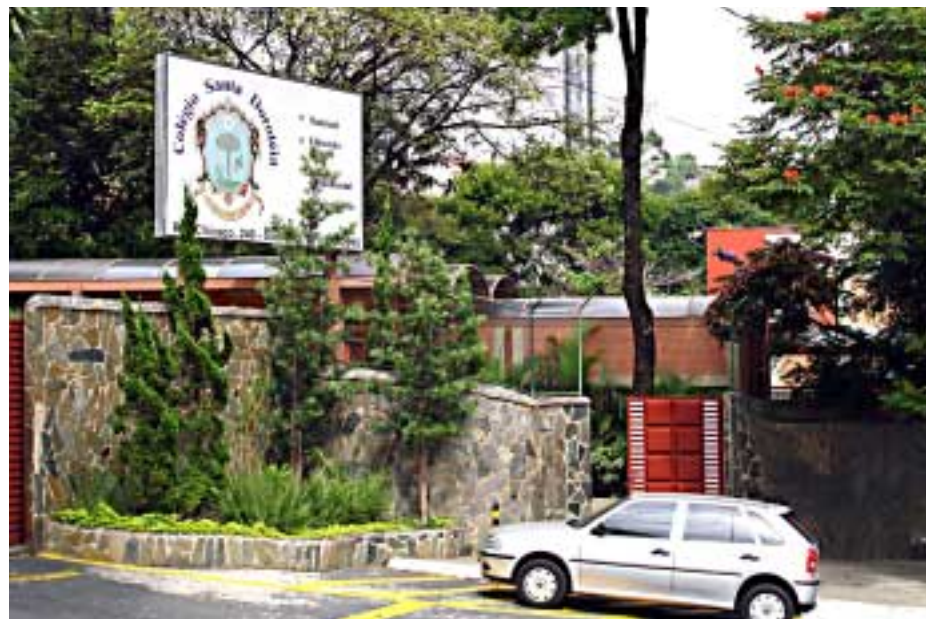
Colégio Santa Dorotéia mantém diversas ações voltadas para moradores do Morro do Papagaio

O colégio mantém ainda a Ação Social Paula Frassinetti. Sua sede na Rua Venezuela, com 700 metros quadrados, abriga uma fábrica de reciclagem de papel e salas para aulas de alfabetização e de informática, além de cursos profissionalizantes de cabeleireiro e garçom.