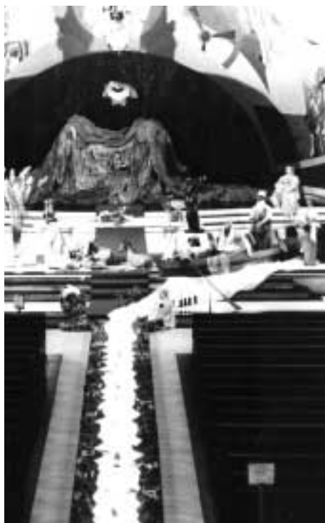
Presépio da Igreja do Carmo atraiu a atenção de moradores de vários bairros e da imprensa

■ ÁRVORE. Sou do espaço e do tempo. Onipresença. Lenho, manjedoura, energia. Movimento e abrigo. Presente maior. Água, ar, vida. Amizade segura. Raiz em frutos. Sou pouso alegre e requintado. Testemunha da civilização. Musa da riqueza em degradação. Em silêncio, firme e paciente. Finco-me no chão a buscar alturas. Gero seiva, sementes e flores. Sensível e genuína, sou cuidadosa.